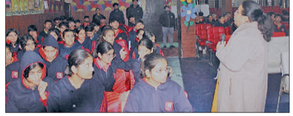
रोहतक। जॉन वेस्ले कॉन्वेंट स्कूल में परामर्श सत्र में भाग लेते विद्यार्थी।