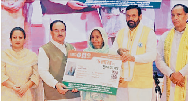
रोहताक। भाजपा के राष्ट्रीय अध्यक्ष जेपी नड्डा कार्यक्रम में शिरकत करते हुए।