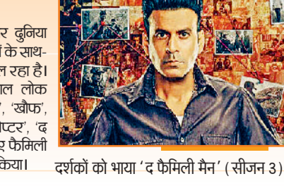
दर्शकों को भाया 'द फैमिली मैन' (सीजन 3)

बीते कुछ वर्षों में एंटरटेनमेंट की एक उमंगान्तर बुनिया विकसित हुई है। इन दिनों थिएटर में रिलीज फिल्मों के साथ-साथ ओटीटी शो को भी दर्शकों का खूब प्यार मिल रहा है। 'द बैड्स ऑफ बॉलीवुड', 'ब्लैक वॉटर', 'पाताल लोक (सीजन 2)', 'पंचायत (सीजन 4)', 'मंडला मर्डर्स', 'खोफ', 'स्पेशल ऑप्स (सीजन 2)', 'आका: द बंगल चैप्टर', 'द फैमिली मैन (सीजन 3)' और 'किंगडम जस्टिस: ए फैमिली मैट' जैसे ओटीटी शो को दर्शकों ने खूब पसंद किया।