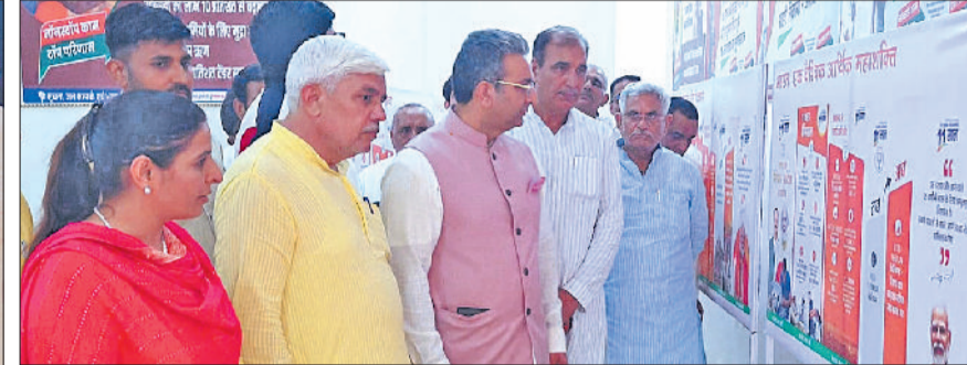
रोहताक। राष्ट्रीय प्रवक्ता गौरव भाटिया मोदी सरकार के 11 साल बेमिसाल प्रदर्शनी का अवलोकन करते हुए