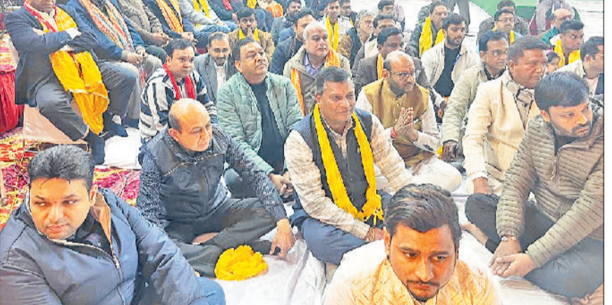
रोहतक। आयोजित कार्यक्रम में उपस्थित भक्तजन।