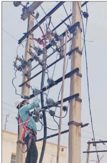
रोहतक। शहर में एक ट्रांसफार्मर पर मरम्मत का कार्य करती बिजली निगम की टीम।

बिजली निगम का मुख्य उद्देश्य यह है कि जब तापमान अपने चरम पर हो और बिजली की मांग कई गुना बढ़ जाए, तब उपभोक्ताओं को बिना रुकावट और सुरक्षित बिजली मिल सके। इसके लिए पुराने और जर्जर तारों को बदला जा रहा है, क्षमता से अधिक लोड झेल रहे ट्रांसफार्मरों को अपग्रेड किया जा रहा है तथा सब स्टेशनों पर तकनीकी सुधार किए जा रहे हैं। इसके साथ ही बिजली लाइनों के आसपास पेड़ों की कटाई कर सुरक्षा को भी प्राथमिकता दी जा रही है, ताकि तेज आंधी या तूफान के दौरान फॉल्ट की संभावना कम हो। यह कार्य केवल आज की जरूरत नहीं, बल्कि भविष्य को ध्यान में रखकर किया जा रहा है। शहर के साथ-साथ ग्रामीण क्षेत्रों में भी बिजली खपत लगातार बढ़ रही है। नए आवासीय क्षेत्र,