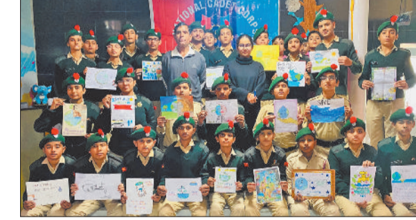
महम। जल संरक्षण का पोस्टर दिखाते एनसीसी कैडेट्स।

महम। रामकृष्ण परमहंस वरिष्ठ माध्यमिक विद्यालय मदीना में 22 से 27 दिसंबर तक जल जीवन मिशन सप्ताह मनाया गया। एनसीसी कैडेट्स ने जल जीवन मिशन को जल उत्सव के रूप में मनाया। सीटीओ सुप्रभा दूहन ने बताया कि इस आयोजन का उद्देश्य विद्यार्थियों और समाज में जल के महत्व को रेखांकित करना तथा जल संरक्षण के प्रति जागरूकता पैदा करना रहा। विद्यार्थियों ने जल ही जीवन है और जल बचाओ, भविष्य बचाओ लिखकर पोस्टर बनाए। इन सशक्त नारों के माध्यम से एनसीसी कैडेट्स ने यह संदेश दिया कि जल को प्रदूषित होने से बचाएं। दैनिक जीवन में किस तरह छोटे लेकिन प्रभावी उपाय अपनाकर जल संरक्षण किया जा सकता है। विद्यार्थियों ने संदेश दिया कि स्वच्छ जल हमारे स्वस्थ जीवन का आधारशिला है। जल संरक्षण विषय पर भाषण प्रतियोगिता का भी आयोजन किया गया।